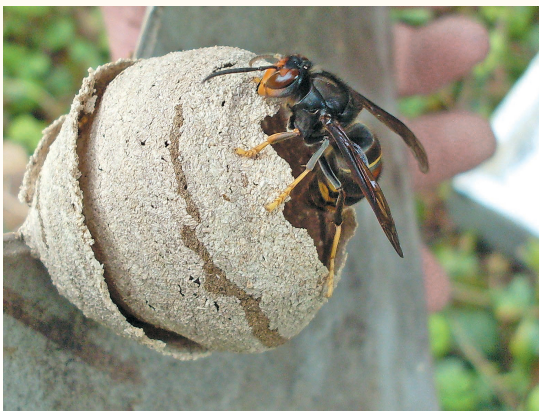
Nid primaire souvent à hauteur d'homme

La période hivernale ne tue pas forcément les fondatrices qui partent du nid